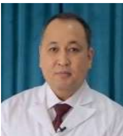
Доктор медицинских наук

Национальный научный кардиохирургический центр г. Астана, Казахстан