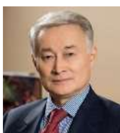
Д.м.н., профессор Байгенжин Абай Кабатаевич Председатель Правления АО «Национальный Научный Медицинский Центр» г. Астана, Казахстан