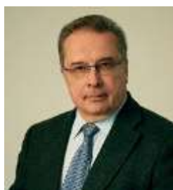
Академик РАН, профессор Беленков Юрий Никитич Президент общества специалистов по сердечной недостаточности Российской Федерации г. Москва, Россия