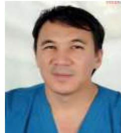
Доктор медицинских наук, доцент

Республиканский специализированный научно-практический медицинский центр кардиологии (РСНПМЦК) г. Ташкент, Узбекистан