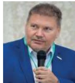
Кандидат медицинских наук

Ведущий научный сотрудник лаборатории тромбовоспаления ФГБНУ «НИИ ревматологии имени В.А. Насоновой» г. Москва, Россия