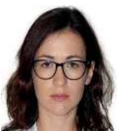
Кандидат медицинских наук

Доцент кафедры нефрологии «ФГБОУ ВО ИГМСУ им. А.И. Евдокимова» Председатель наблюдательного совета Ассоциации мед. организаций по нефрологии и диализу АМОНД г. Москва, Россия