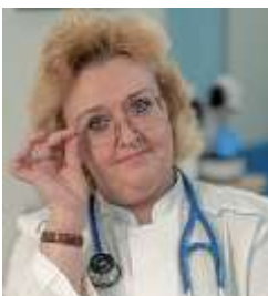
Доктор медицинских наук

Национальный научный кардиохирургический центр г. Астана, Казахстан