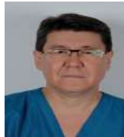
Кандидат медицинских наук

Кардиохирург отдела миниинвазивной кардиохирургии РСНПМЦК г. Ташкент, Узбекистан